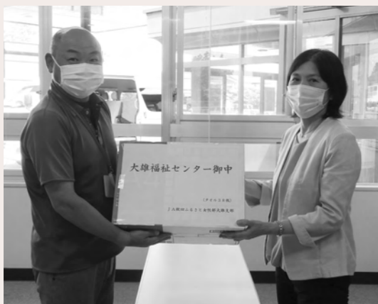
JA秋田ふるさと女性部大雄支部様よりタオルをご寄贈いただきました