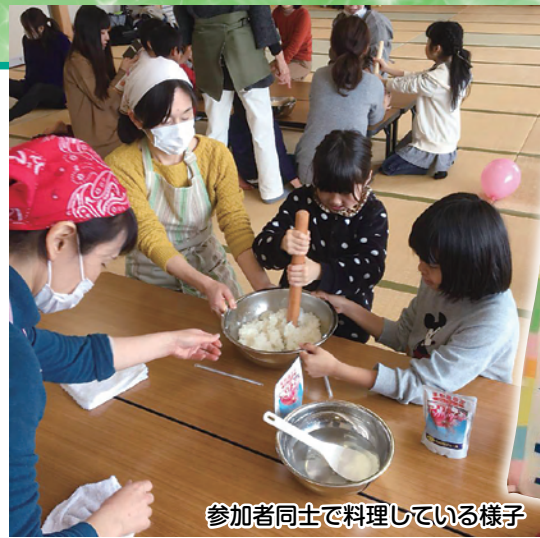
参加者同士で料理している様子

コロナ禍の影響により食事提供の機会を中止することもありましたが、この状況下でもできる「お弁当配布」や「無料食糧支援」などの取り組みも新たに始めました。