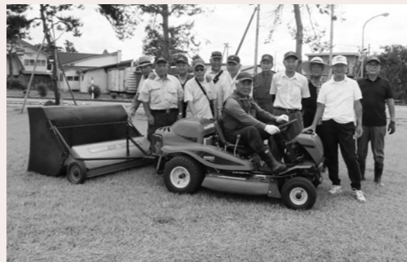
大雄グラウンドゴルフ同好会様より大雄地域福祉センター敷地の除草をしていただきました