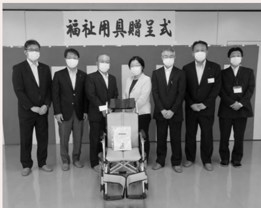
秋田県東部郵便局長会平鹿部会様より車いすをご寄贈いただきました