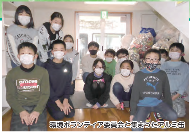
環境ボランティア委員会と集まったアルミ缶

雄物川小学校では「一日一歩 夢に向かって明日を創ろう」を合言葉に活動を行っています。