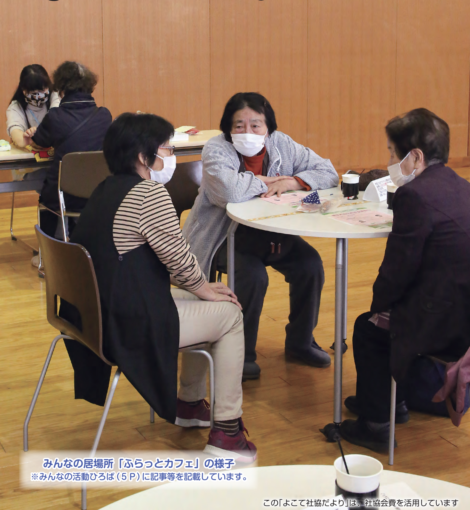
みんなの居場所「ふらっとカフェ」の様子