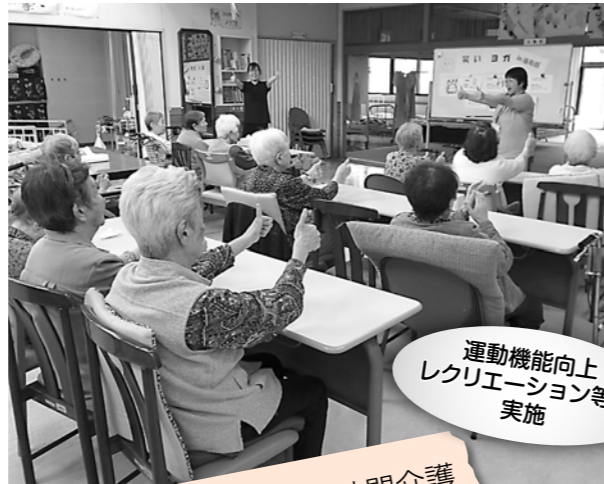
運動機能向上 レクリエーション等の 実施

地域福祉事業との更なる連携強化と介護人材の資質向上を図りながら、高齢者や障がい者等が安心して暮らすことができる質の高いサービス提供に努めます。