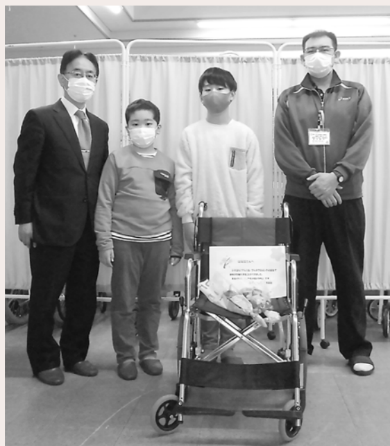
雄物川小学校様より車いすを寄贈いただきました