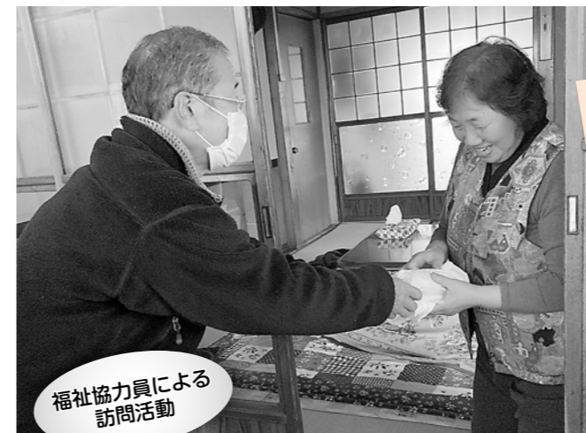
福祉協力員による 訪問活動

福祉協力員活動、社会参加支援活動、声の広報・点字広報の発行、緊急通報システムの推進、福祉団体事務の支援など