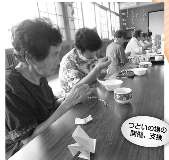
つどいの場の 開催、支援

小ネットワーク会議、ボランティアの支援、災害・除雪ボランティア活動、つどいの場ランディア活動、つどいの場普及、各種情報の発信、福祉教育活動、福祉出前講座、支えあい活動の啓発・普及、災害時避難支援体制の構築、社災会福祉大会など