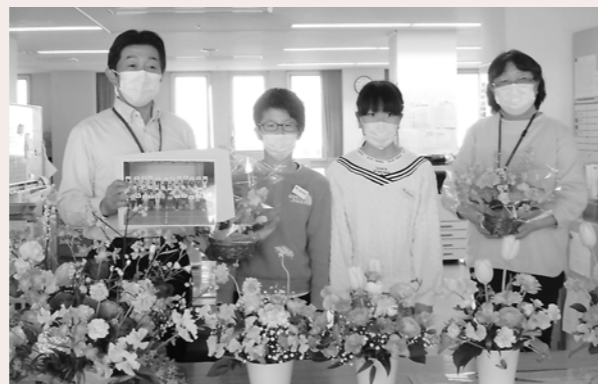
浅舞小学校様よりアレンジメントフラワーを寄贈いただきました