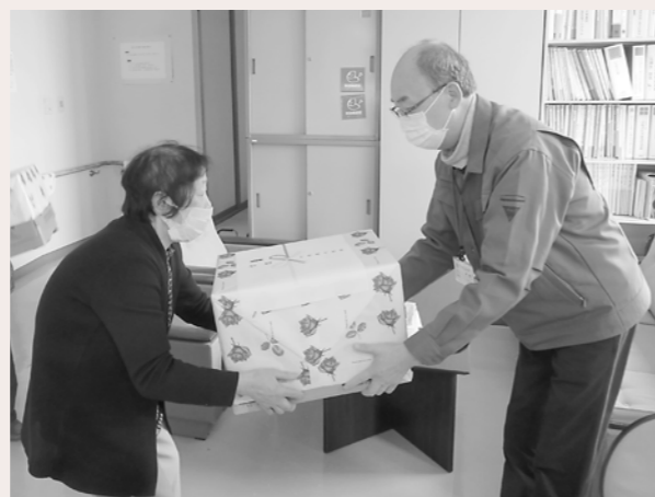
十文字地域老人クラブ連合会女性部様より清拭タオルを寄贈いただきました